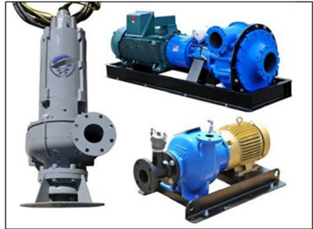
*Imagen de Despliegue Típico. Las bombas de Dragado pueden ser desplegadas horizontalmente o verticalmente. Fotos referenciales. Contáctenos para más información.